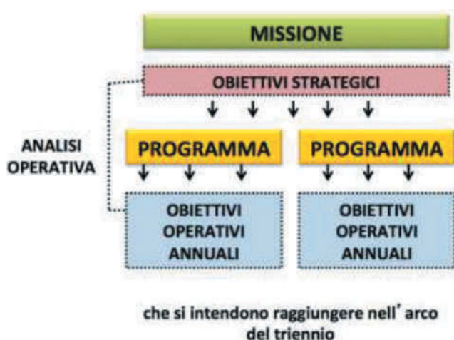
Tavola 7 - L'analisi operativa del DUP

La sezione operativa si divide in due parti: la prima, i cui contenuti sono in tutto e per tutto simili a quelli della vecchia relazione previsionale e programmatica e la seconda, che ospita i tre documenti programmatici (piano triennale delle opere pubbliche, fabbisogno del personale e piano delle alienazioni) a corollario e completamento della prima parte.