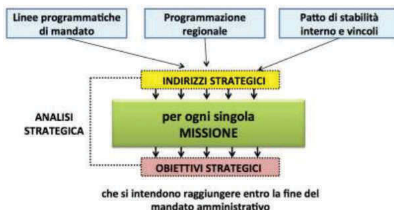
Tavola 4 - La sezione strategica del DUP