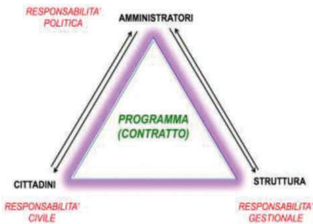
Tavola 2 - Il programma come contratto tra amministratori, cittadini e struttura

governo politico dell'ente assume nei confronti dei cittadini e degli altri utilizzatori del sistema di bilancio stesso. L'attendibilità, la congruità e la coerenza dei bilanci è prova della affidabilità e credibilità dell'Amministrazione. Gli utilizzatori del sistema di bilancio devono disporre delle informazioni necessarie per valutare gli impegni politici assunti e le decisioni conseguenti, il loro onere e, in sede di rendiconto, il grado di mantenimento degli stessi". L'identificazione dell'attività di programmazione e del suo risultato (il programma) come un contratto che lega amministratori, cittadini e struttura amministrativa mantiene ancora oggi tutta la sua attualità, rinvigorita dalla riforma federalista avviata con la riforma del titolo V della Costituzione introdotta dalla Legge costituzionale n. 3/2001 e la Legge delega n. 42/2009. Obiettivo del federalismo, infatti, è proprio quello di avvicinare la politica ai cittadini, stringendo un legame indissolubile tra risorse provenienti dal territorio e risultati raggiunti per la collettività, che ha il suo test di verifica nel momento elettorale del rinnovo degli organi di governo. Con il D.Lgs. n. 170/2006 il legislatore aveva provveduto ad effettuare una ricognizione dei principi fondamentali in materia di armonizzazione dei bilanci pubblici, conseguenti all'autonomia costituzionale sancita con la riforma. Per gli Enti locali, i documenti fondamentali di programmazione (art. 13 (2)) sono stati individuati: