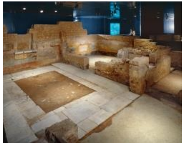
Le Domus dell'Ortaglia ed il Viridarium