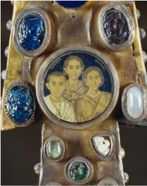
La Croce di Desiderio