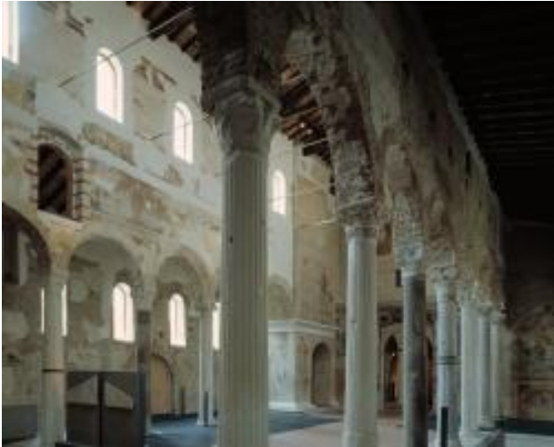
La basilica di San Salvatore