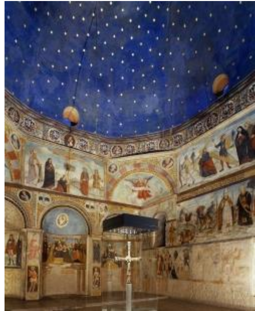
La chiesa di Santa Maria in Solario